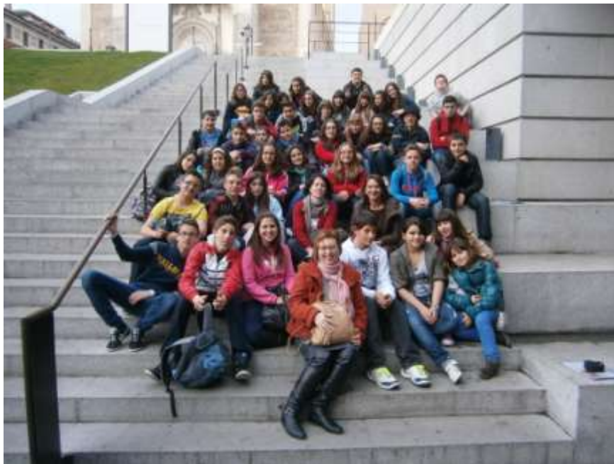
Tots a l'entrada del Museo del Prado