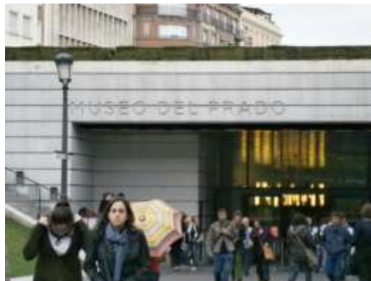
Entrada al Museo del Prado