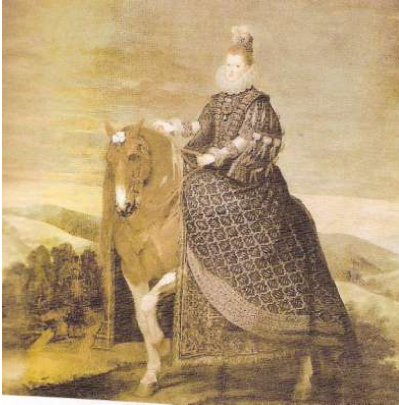
La Reina Margarita de