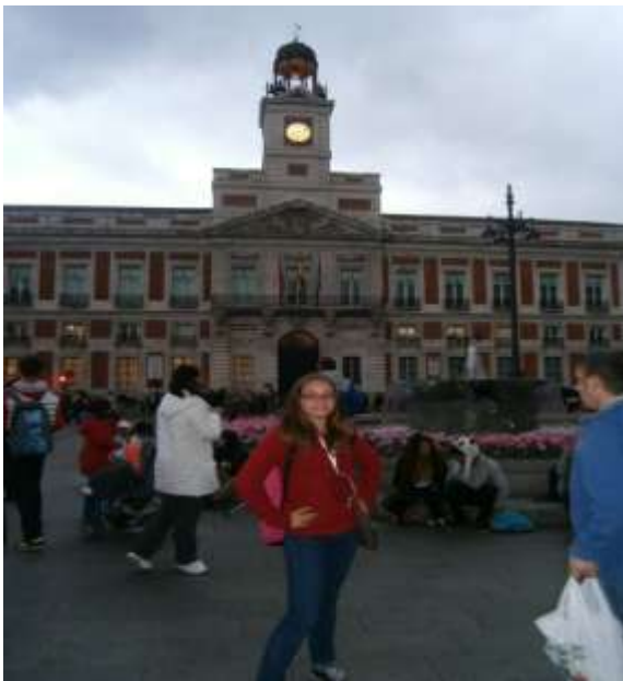
“Puerta del Sol”